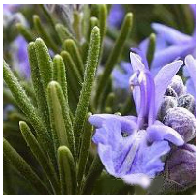
迷迭香 ( Rosmarinus officinalis L. )